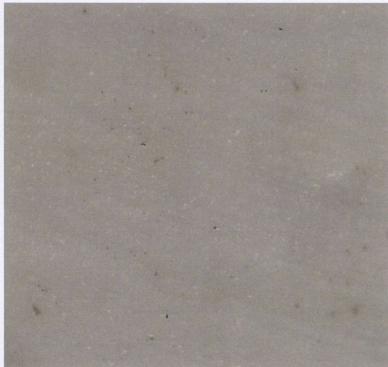
Foto 2: Untersuchungsmaterial OTTOSEAL S 68 nach einer Inkubationszeit von 28 Tagen (50fach vergrößert): Leichtes Schimmelpilzwachstum sichtbar