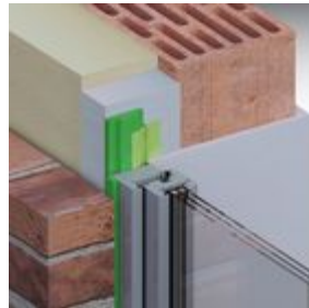
Lösungsmöglichkeit: ME350 Fensterfolie Innen VV FM230 Fensterschaum+ TP600 illmod 600