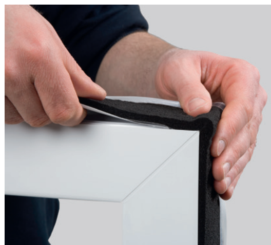
Einbaubeispiel: ISO-BLOCO ONE

* Bauteilbewegung und temporäre Längenänderungen der vorhandenen Fugen sind bei der Ermittlung der geeigneten Banddimension zu berücksichtigen.