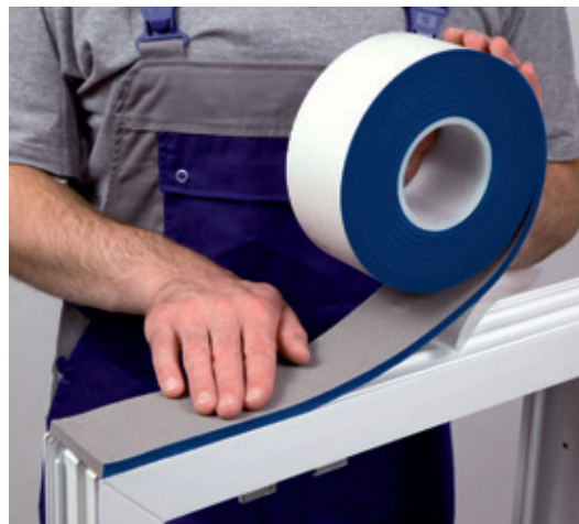
Einbaubeispiel: ISO-BLOCO MULTIFUNKTIONSBAND

* Bauteilbewegungen und temporäre Längenänderungen der vorhandenen Fugen sind bei der Ermittlung der geeigneten Banddimension zu berücksichtigen.