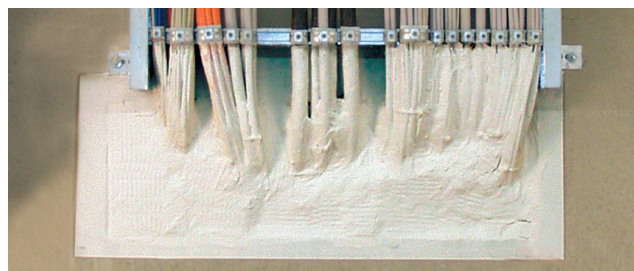
Einbaubeispiel: ISO-FLAME PLATTE S 90

* Zu den Bedingungen des Herstellers (auf Wunsch erhältlich).